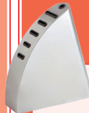
Tacoma Inox P.V.P. NORMAL: 25,98€

Fabricada en acero inoxidable. Capacidad para 5 cuchillos y afilador.